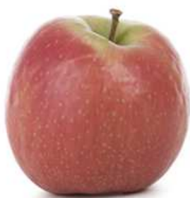
Ra = 60 (CRI)

Ra >80 - minimalna wartość współczynnika oddawania barw (oznaczanego również CRI)